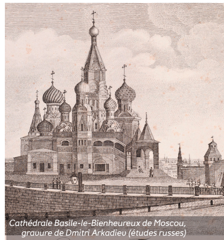
Cathédrale Basile-le-Bienheureux de Moscou, gravure de Dmitri Arkadieïev (études russes)