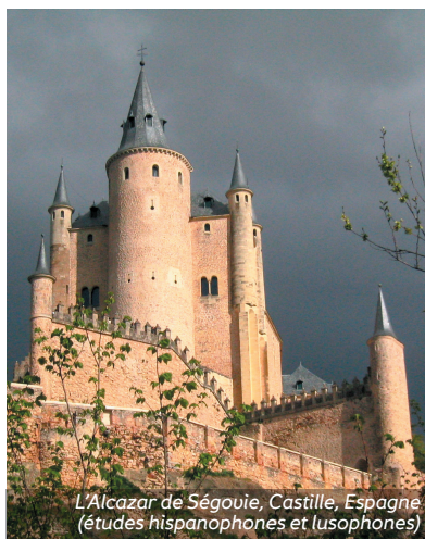
L'Alcazar de Ségovie, Castille, Espagne (études hispanophones et lusophones)