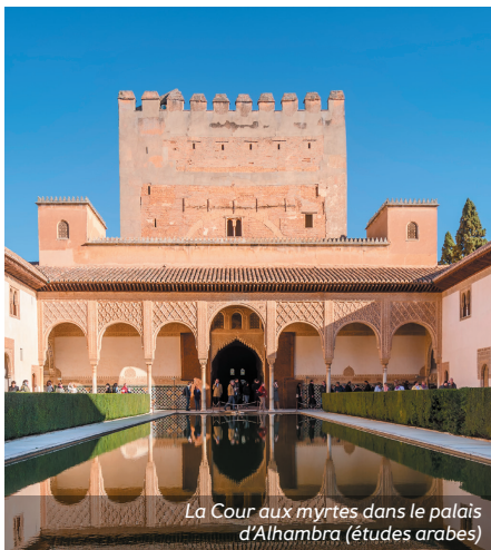
La Cour aux myrtes dans le palais d'Alhambra (études arabes)