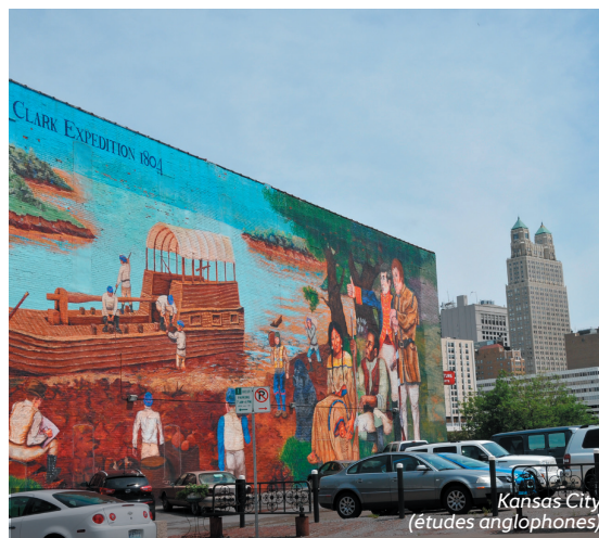
Kansas City (études anglophones)