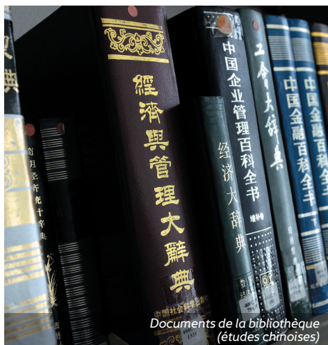
Documents de la bibliothèque (études chinoises)