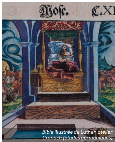
Bible illustrée de Luther, atelier Cranach (études germaniques)